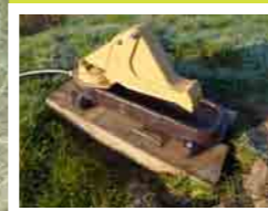
Pompe à museau