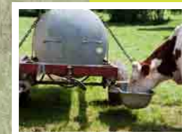
Tonne à eau