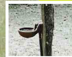
Eau de conduite