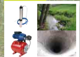
Pompe immergée ou groupe hydrophore